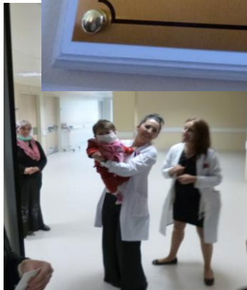
ここにも摂津RCの文字が