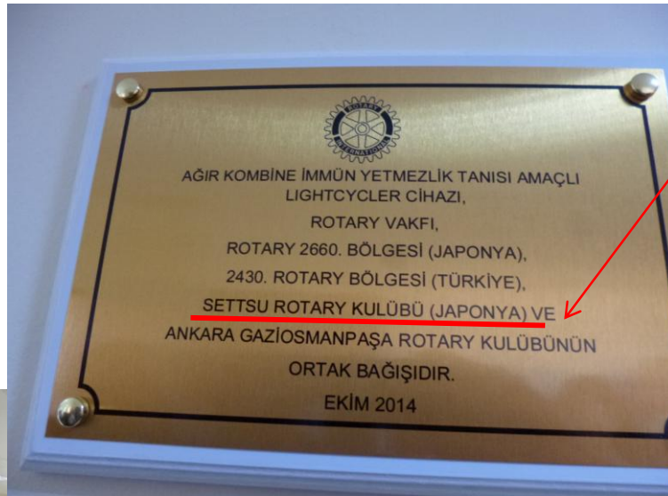
検査室の入口の銘盤